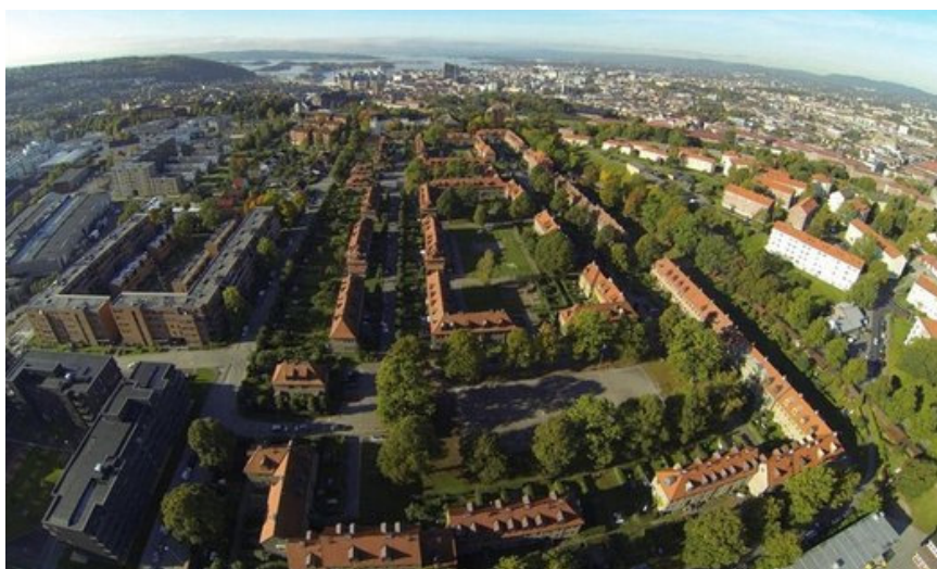
Borettslaget Lille Tøyen Hageby.