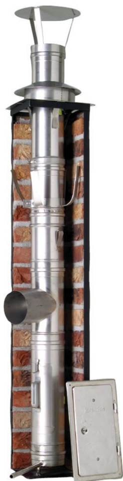
EW uisolert elementskorstein.