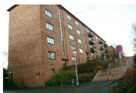
Kampens Byggeselskap AS.